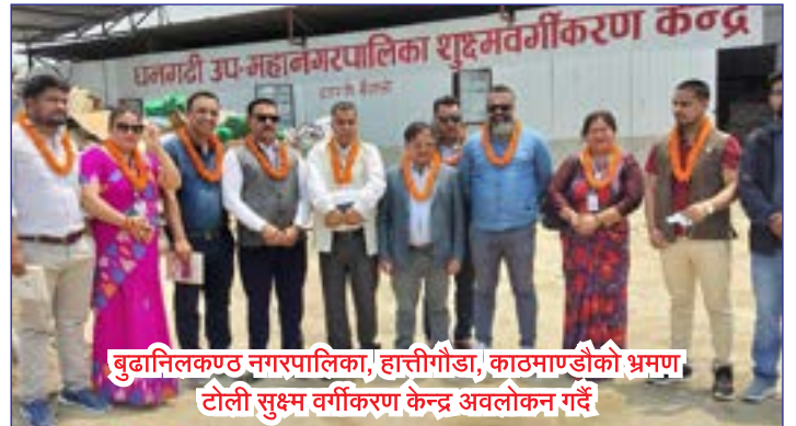
बुढानिलकण्ठ नगरपालिका, हात्तीगौडा, काठमाण्डौको भ्रमण टोली सुक्ष्म वर्गीकरण केन्द्र अवलोकन गर्दै