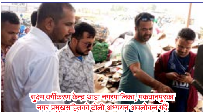
सुक्ष्म वर्गीकरण केन्द्र थाहा नगरपालिका, मकवानपुरका नगर प्रमुखसहितको टोली अध्ययन अवलोकन गर्दै