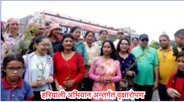
हरियाली अभियान अन्तर्गत वृक्षारोपण