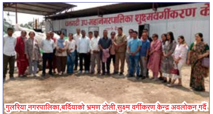
गुलरिया नगरपालिका, बर्दियाको भ्रमण टोली सुक्ष्म वर्गीकरण केन्द्र अवलोकन गर्दै