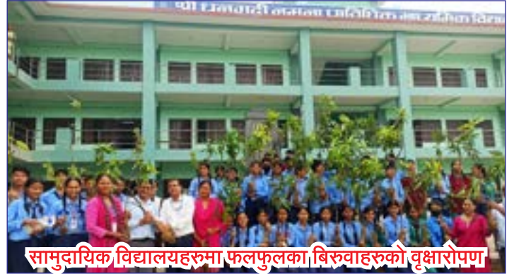
सामुदायिक विद्यालयहरुमा फलफुलका बिरुवाहरुको वृक्षारोपण