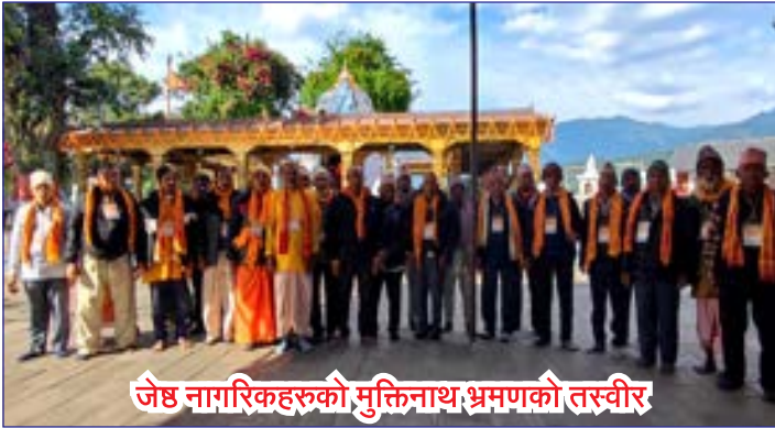
जेष्ठ नागरिकहरुको मुक्तिनाथ भ्रमणको तस्वीर