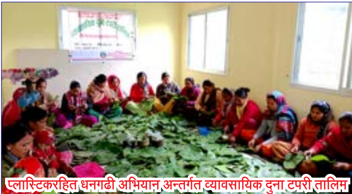
प्लास्टिकरहित धनगढी अभियान अन्तर्गत व्यावसायिक दुना टपरी तालिम