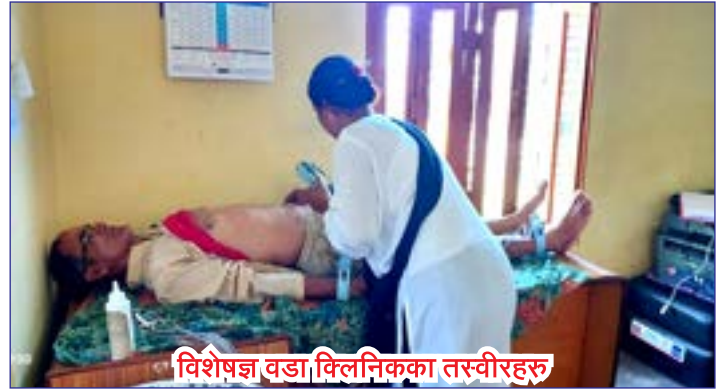
विशेषज्ञ वडा क्लिनिकका तस्वीरहरु